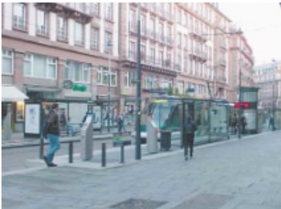
アクセスしやすい駅は改札はなく自分で購入した切符に機械で入鉄(にゆうきょう)して乗り込むようになっている