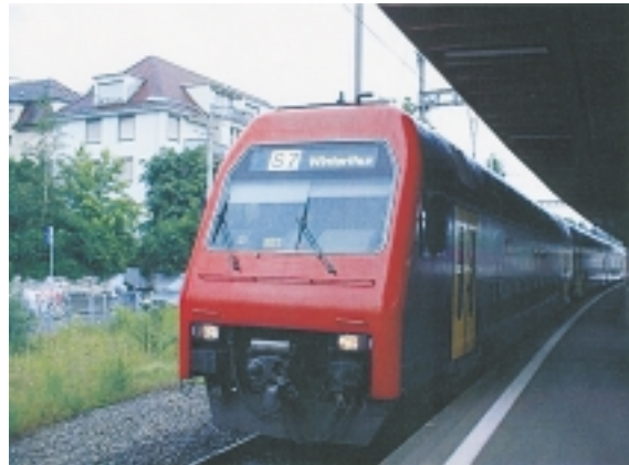
郊外線を走るSバーン。新型の2階建である。