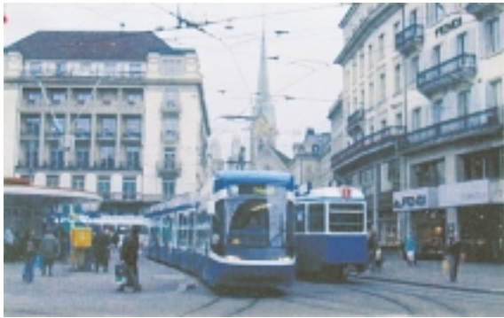
金融センターのある市街地を走る路面電車。新旧のタイプが走っている。