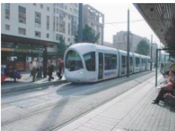
リオンのLRTはフロント部分の形に特徴があり、 他の都市とは別の印象をうける