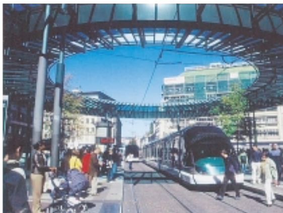
賑わいを見せる南北線と東西線の交差点にあたる ホムド・フェール駅