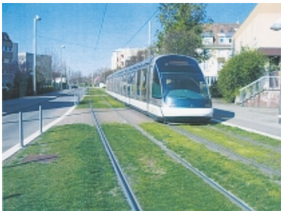
路面には芝生を植えて街の景観を向上させている 区間もある