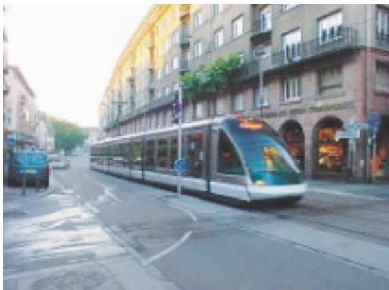
ゆっくりと中心市街地を走るストラスプールの最新式のLRT