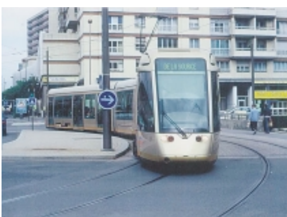
オルレアンのLRTの車両幅は標準よりも狭く、回転 半径を小さくして小廻りが利くように設計されている